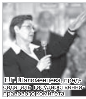
Е.Г. Шаломенцева, председатель государственного правового комитета